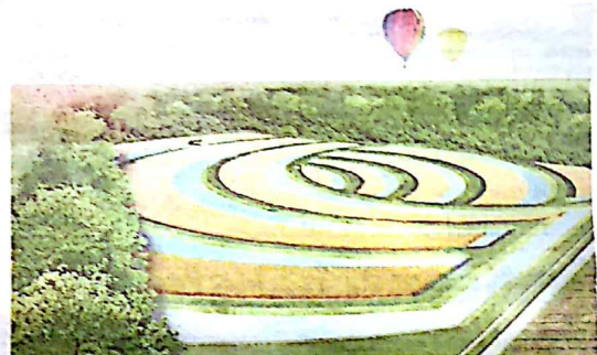
Een stelsel van dijkes en waterpartijen van verschillende diepte.

BEGRAZING De dijkes zullen worden begraasd door schapen, waardoor ze als strakke elementen zichtbaar blijven, aldus de bedenkers. Voor die begrazing worden plaatselijke veehouders benaderd. Tussen de Viskringloop en het Oeverse Bos wordt een boszoom aangelegd. „Om een mooie