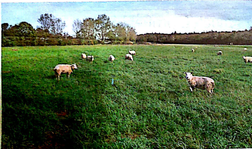
De schapen krijgen in 2020 gezelschap van vissen.